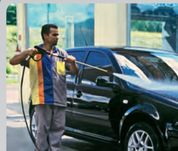
Postos de serviços